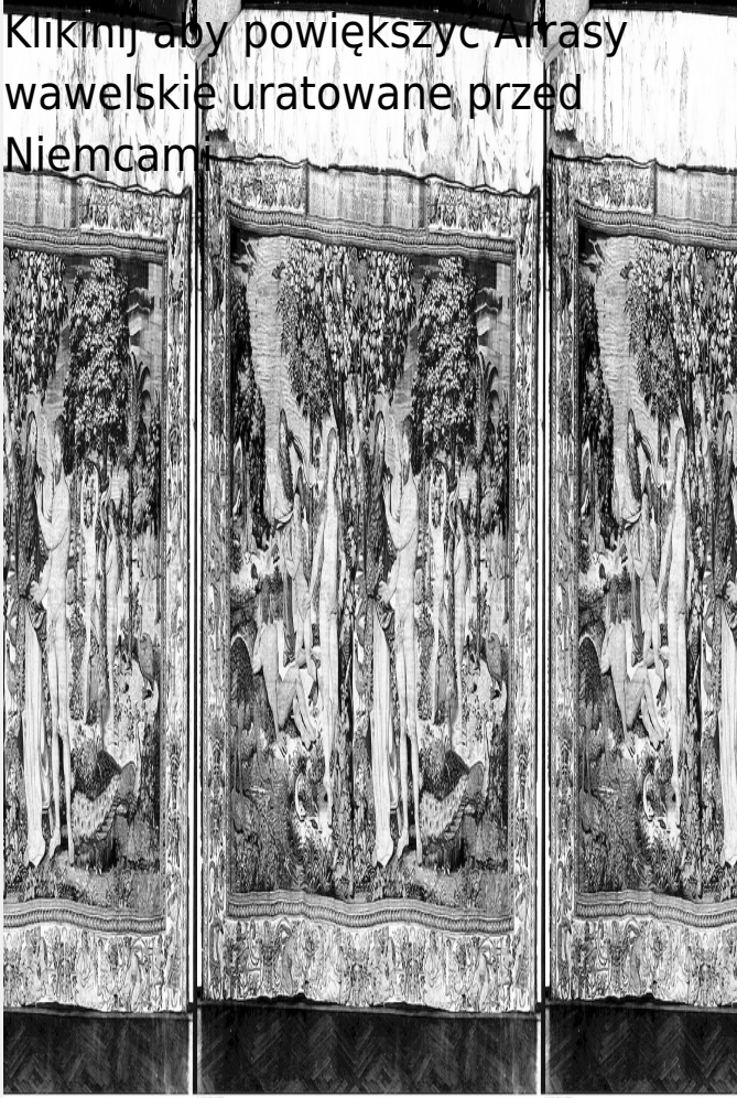
Arrasy wawelskie uratowane przed Niemcami

Kliknij aby powiększyć Arrasy wawelskie uratowane przed Niemcami