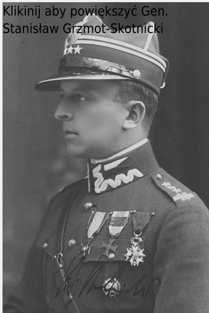
Gen. Stanisław Grzmot-Skotnicki

Kliknij aby powiększyć Gen. Stanisław Grzmot-Skotnicki