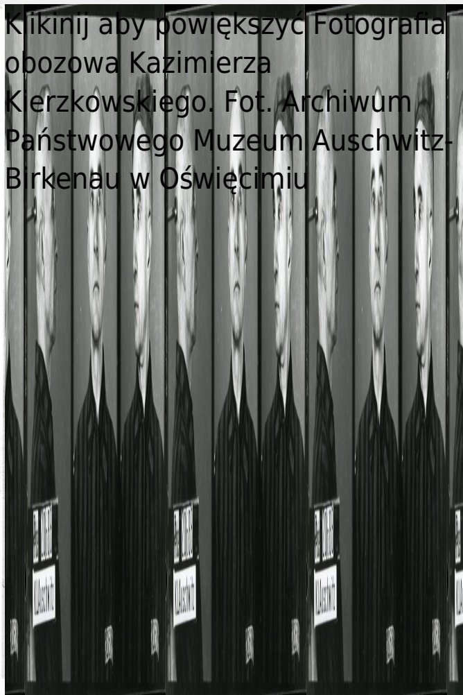
Fotografia obozowa Kazimierza Kierzkowskiego. Fot. Archiwum Państwowego Muzeum Auschwitz-Birkenau w Oświęcimiu

Kliknij aby powiększyć Fotografia obozowa Kazimierza Kierzkowskiego. Fot. Archiwum Państwowego Muzeum Auschwitz-Birkenau w Oświęcimiu