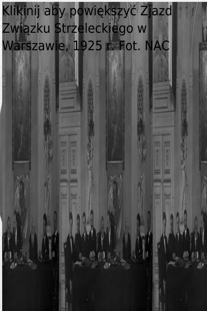
Zjazd Związku Strzeleckiego w Warszawie, 1925 r. Fot. NAC

Kliknij aby powiększyć Zjazd Związku Strzeleckiego w Warszawie, 1925 r. Fot. NAC