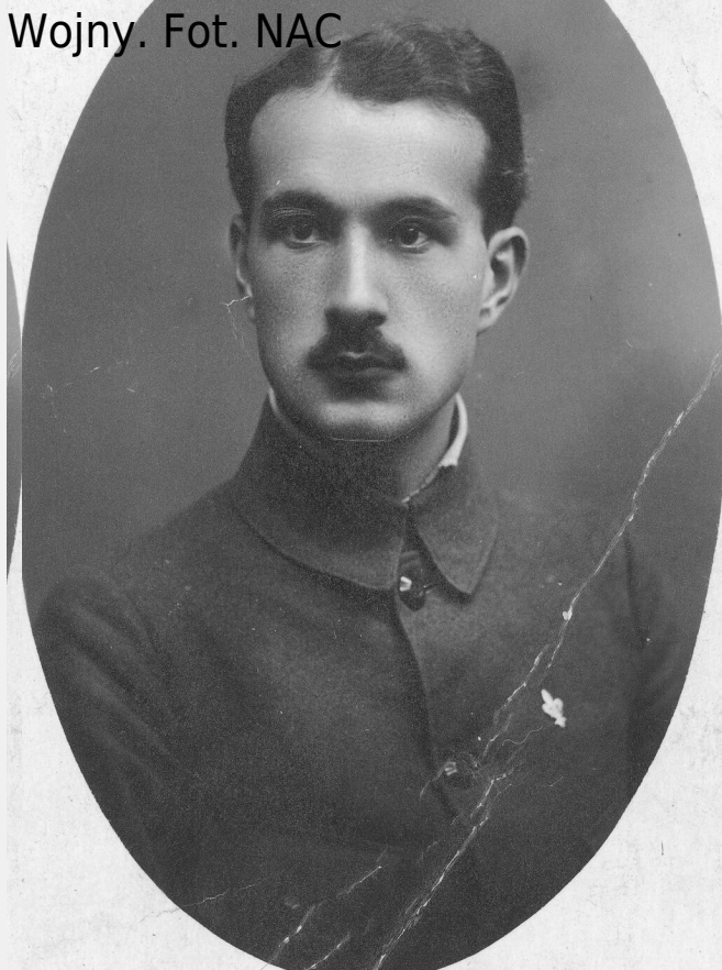
Kazimierz Kierkowski w okresie Wielkiej Wojny. Fot. NAC

Kliknij aby powiększyć Kazimierz Kierkowski w okresie Wielkiej Wojny. Fot. NAC