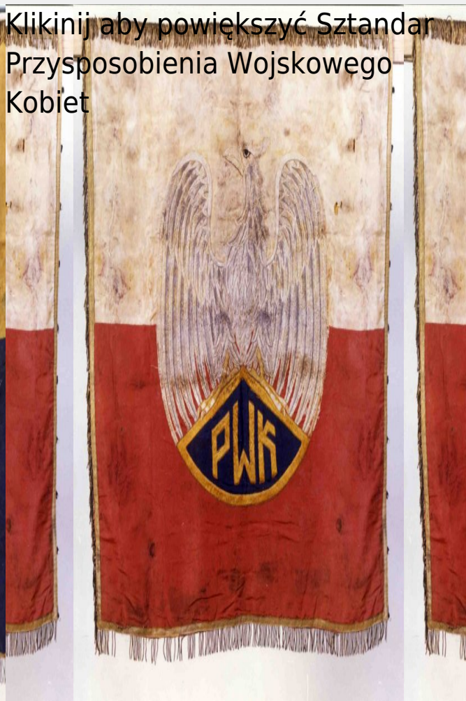
Sztandar Przysposobienia Wojskowego Kobiet

Kliknij aby powiększyć Sztandar Przysposobienia Wojskowego Kobiet