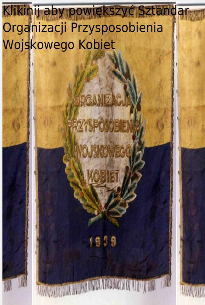
Sztandar Organizacji Przysposobienia Wojskowego Kobiet

Kliknij aby powiększyć Sztandar Organizacji Przysposobienia Wojskowego Kobiet