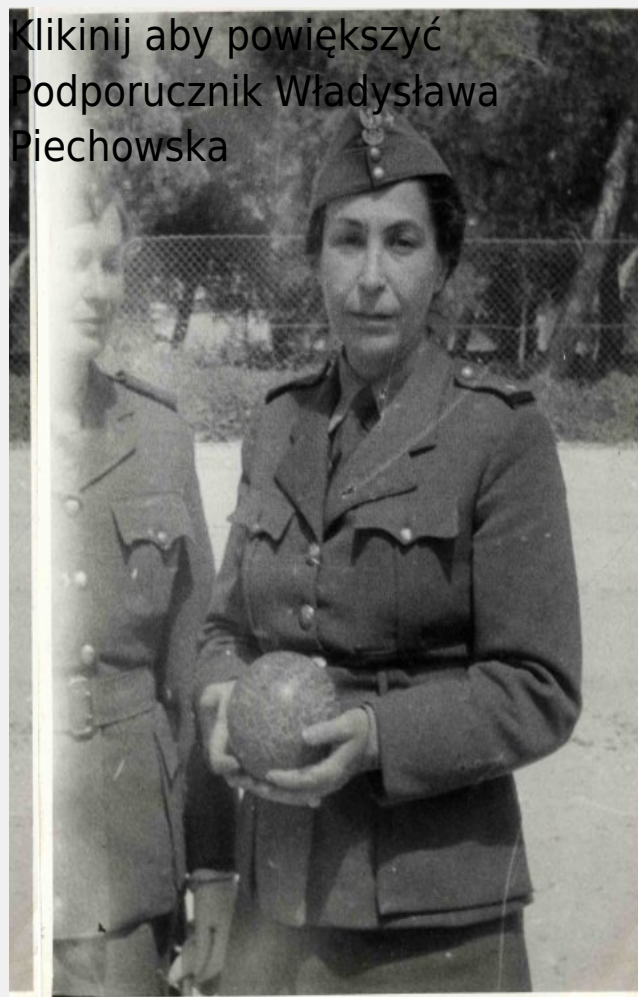
Kliknij aby powiększyć Podporucznik Władysława Piechowska

Kliknij aby powiększyć Relacja z przebiegu służby wojskowej Władysławy Piechowskiej w wrześniu 1939 r. #1